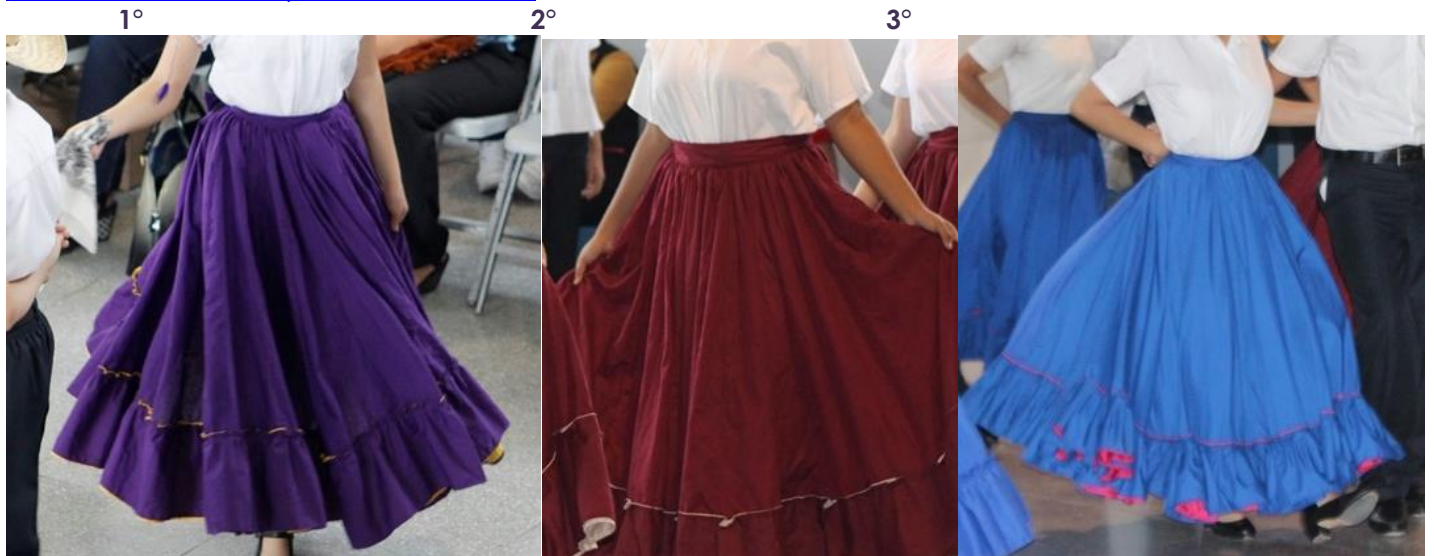
La falda guinda de 2do. Secundaria es la que usaron el ciclo anterior las alumnas que estuvieron en 1ro.sec. 2022-2023