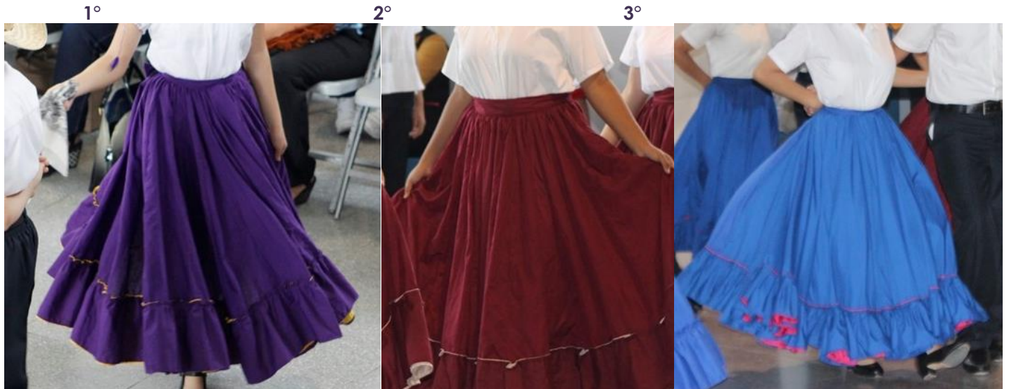
La falda azul de 3ro. Secundaria es la que usaron el ciclo anterior las alumnas que estuvieron en 2do.sec. 2022-2023